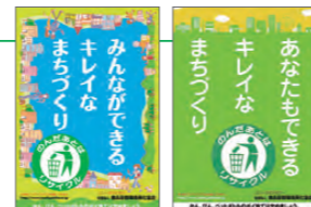
ポイ捨て防止の啓発ポスター

統一美化マーク（上記）のもと、各種媒体やメディアを通じて、散乱防止の啓発に努めています。これまで駅や社内のポスター・ステッカー、道路沿いの立看板、ポスターの掲出、パスラッピング広告など、時々の情勢に応じた方法で、散乱防止を呼びかけています。