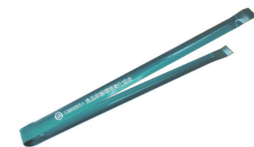
トンブ （サイズ 長さ 30cm × 幅 2.3cm）