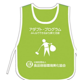
ビブス （サイド紐タイプ、フリーサイズ／着丈 63cm × 身丈 50cm）