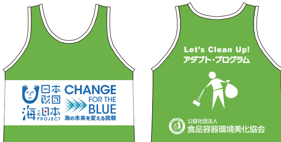
ビブス(メッシュタイプ)(フリーサイズ/横幅56cm×高さ63cm)