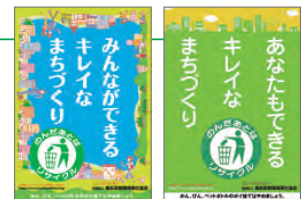
ポイ捨て防止の啓発ポスター

統一美化マーク(上記)のもと、各種媒体やメディアを通じて、散乱防止の啓発に努めています。これまで駅や社内のポスター・ステッカー、道路沿いの立看板、ポスターの掲出、バスラッピング広告など、時々の情勢に応じた方法で、散乱防止を呼びかけています。