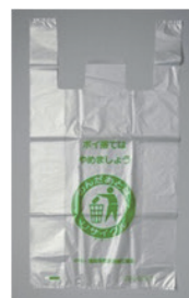
回収用ごみ袋 (レジ袋サイズ/可燃・無公害)