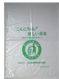
回収用ごみ袋 (30Lサイズ/可燃・無公害)