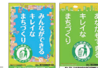
ポイ捨て防止の啓発ポスター

これまで駅や社内のポスター・ステッカー、道路沿いの立看板、ポスターの掲出、バスラッピング広告など、時々の情勢に応じた方法で、散乱防止を呼びかけています。