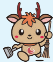
広島県アダプト制度マスコットキャラクター「アダピィ」

会員の高齢化の解消や青少年に「アダプト活動に参加することの意義・楽しさ」を知ってもらうため、青少年の活動団体を応援するフォーラムを年1回開催し、活動成果発表の場を設け、表彰を行っています。